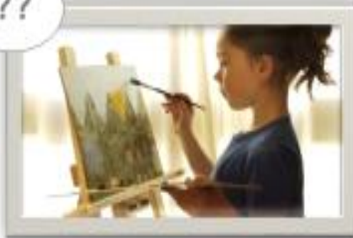
Негосударственные организации дополнительного образования (ЧАСТНЫЕ)