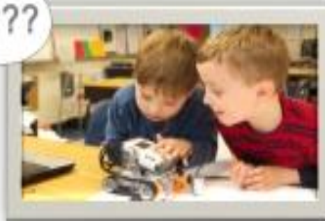
Поставщики образовательных услуг