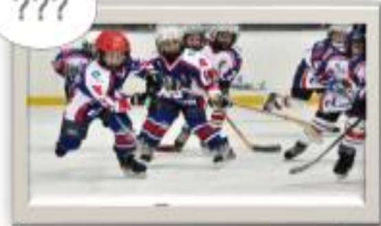
Учреждения, подведомственные Департаменту культуры